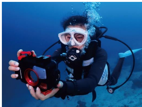
防水プロテクター「PT-059」使用イメージ