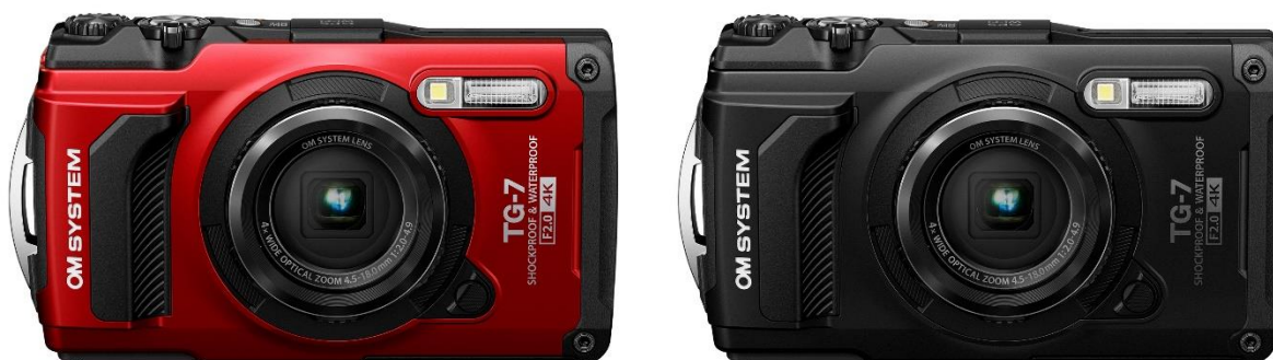
「OM SYSTEM Tough TG-7」（レッド／ブラック）

OM デジタルソリューションズ株式会社（代表取締役社長 兼 CEO：杉本 繁実）は、防水 15m ※1 、耐低温-10°Cの高い耐環境性能と、レンズ先端 1cm まで近接撮影可能な高い接写性能を併せ持つ、OM SYSTEM ブランドとして初となる Tough シリーズのコンパクトデジタルカメラ「OM SYSTEM Tough TG-7」を 2023 年 10 月 13 日に発売します。別売の専用防水プロテクター「PT-059」を使うことで、水深 45mまでの本格的な水中撮影にも対応するなど、コンパクト、軽量ながら水中から山岳までさまざまなアドベンチャーなシーンでも撮影可能な、まさに OM SYSTEM らしさを体現したカメラといえます。