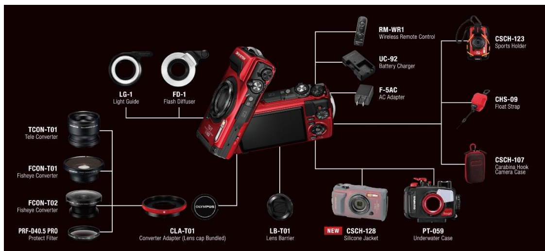
「OM SYSTEM Tough TG-7」の撮影領域を広げる多彩なアクセサリ類