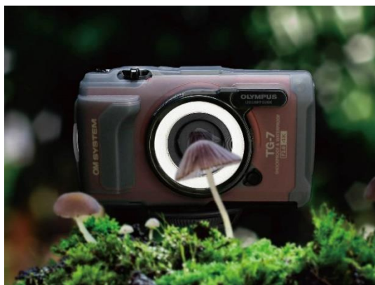
LED ライトガイド「LG-1」使用イメージ

近接撮影時に生じやすい被写体の明るさ不足を補うことができる LED ライトガイド「LG-1」、フラッシュディフューザー「FD-1」が使用できます。いずれもワンタッチでカメラに装着、別電源の必要もなく手軽に使えるのが特長です。