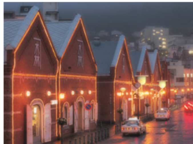
ファンタジックフォーカス