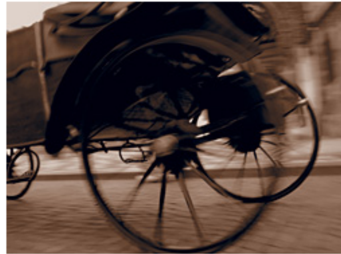
ジェントルセピア