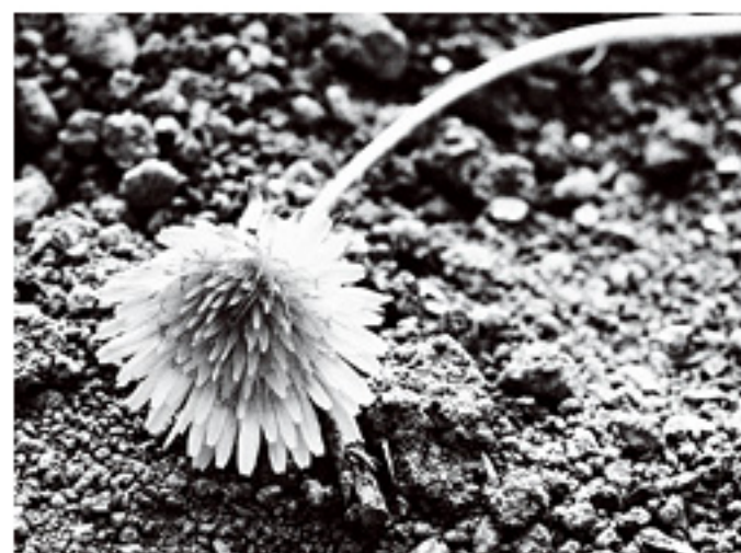
ラフモノクローム