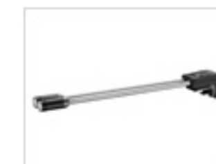
> マクロアームライト MAL-1