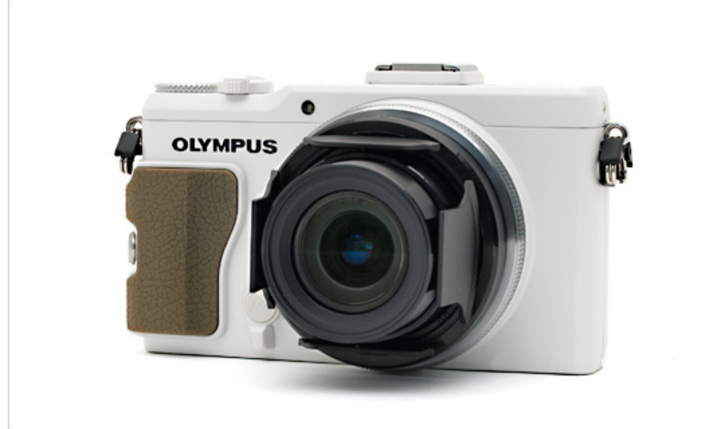
XZ-2 WHT + LC-63A