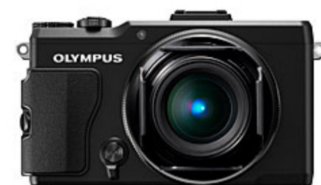
キャップを開いた状態