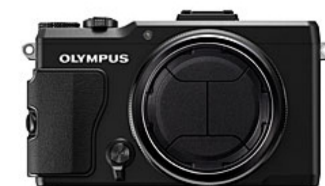
キャップを閉じた状態