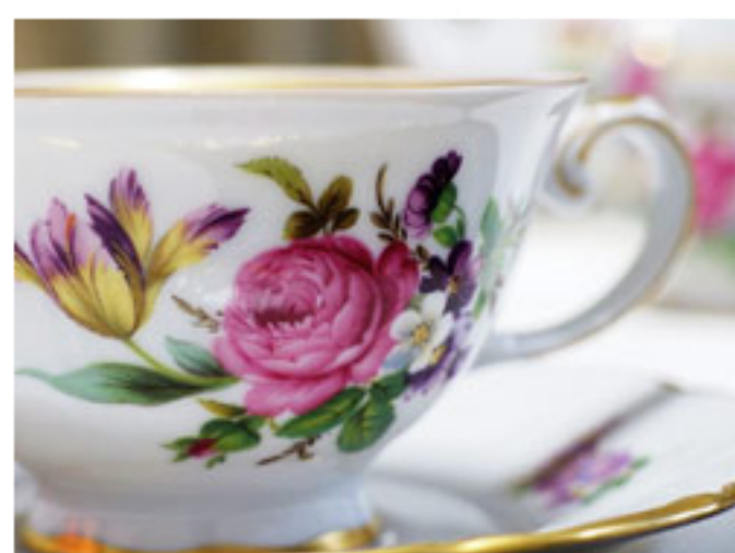
通常の撮影モードでのマクロ撮影 焦点距離:112mm(35mmカメラ換算) 絞り:F2.5

全ての焦点距離において、約30mm×60mm付近の被写体を画面いっぱい撮影することができます。ズーミングしながら被写界深度を調整して撮影できるので、快適に作画に専念できます。