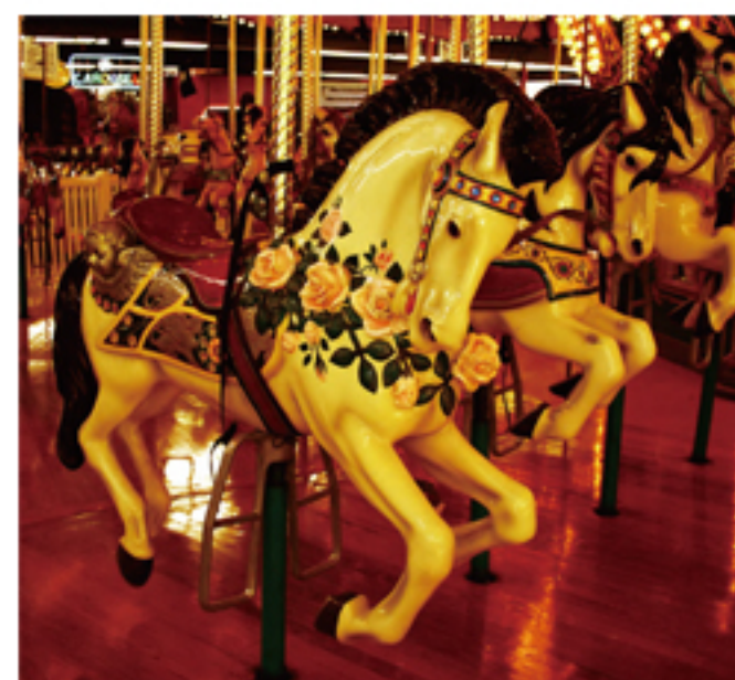
XZ-2 F1.8 1/60 ISO1600