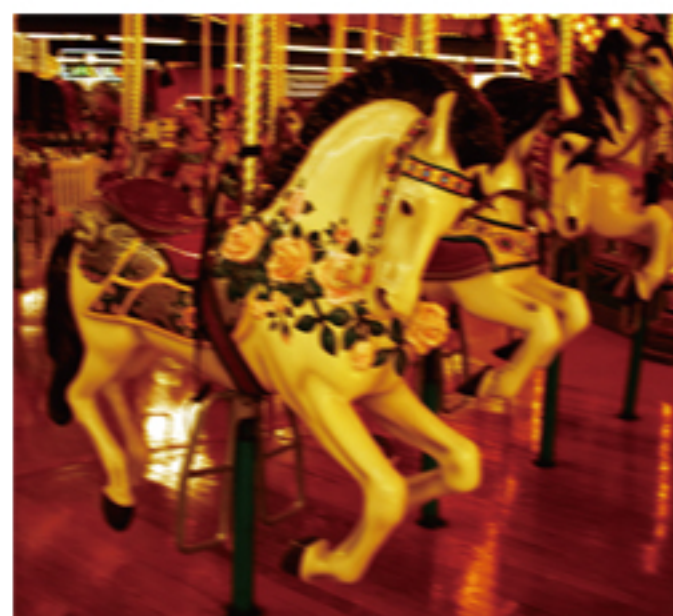
通常のコンパクトカメラ F5 1/15 ISO1600

ワイド側ではF1.8の明るさ。暗い場所の撮影でも手ぶれを気にせずに撮影できます。