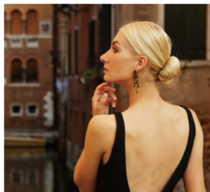
通常のコンパクトカメラ F5.6

テレ端側F2.5の開放絞り値が、味わい深い印象的な写真表現を可能とします。ポートレートやマクロ撮影ではボケ味溢れかちて、被写体を強調した写真が撮影できます。