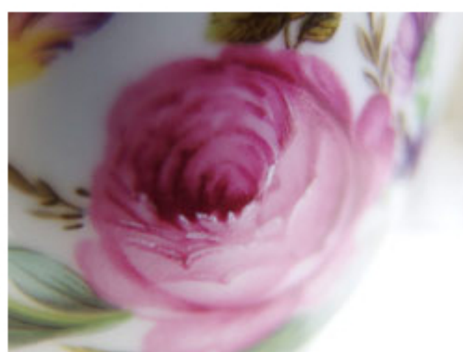
スーパーマクロモードでの撮影 (約1cmまで寄れます) 焦点距離:28mm(35mmカメラ換算) 絞り:F1.8