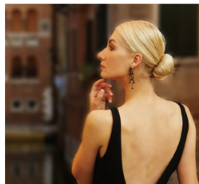
XZ-2 F2.5 1/300