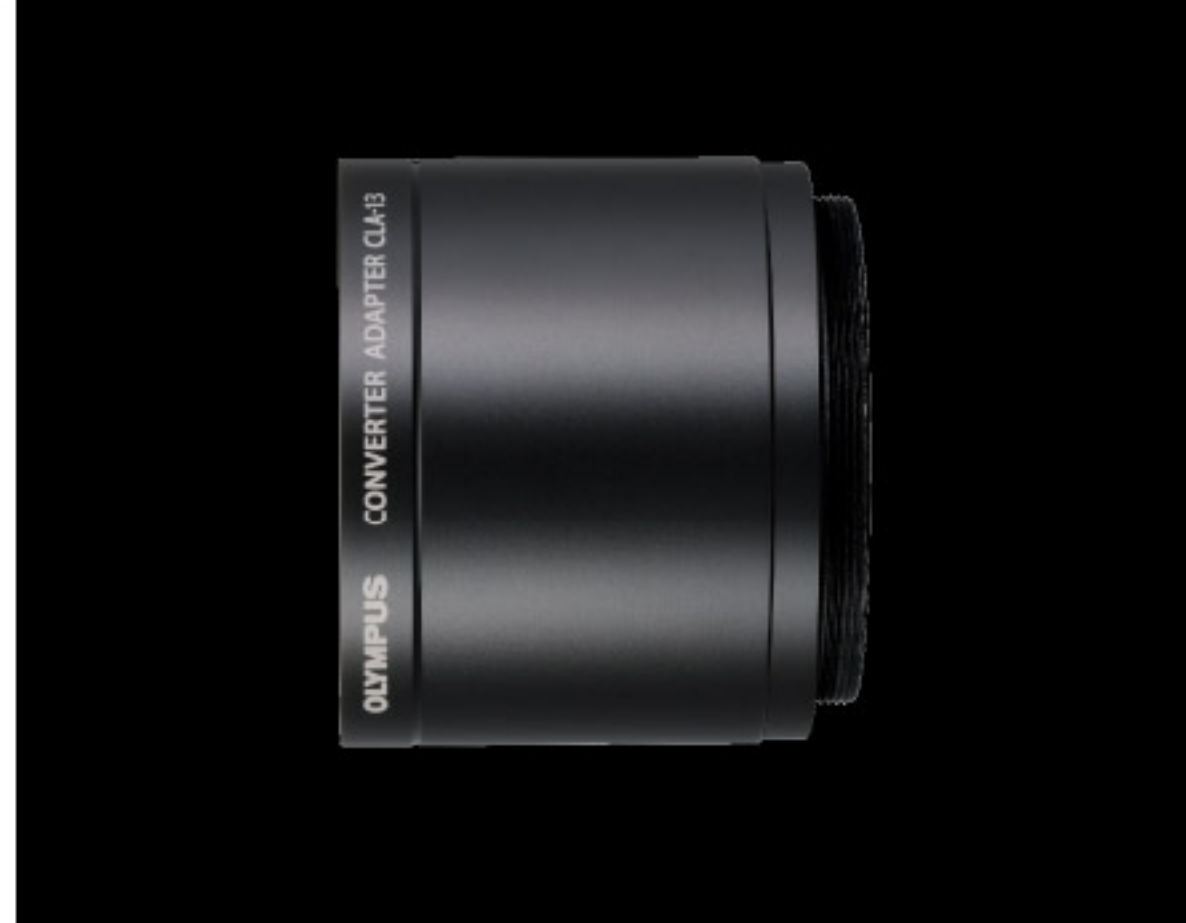
コンバージョンレンズアダプター CLA-13

※写真はイメージです。 ※画面はハメコミ合成です。 ※一部の製品写真で別売のアクセサリを取り付けた状態で撮影しております。ご購入の際は商品名をご確認ください。