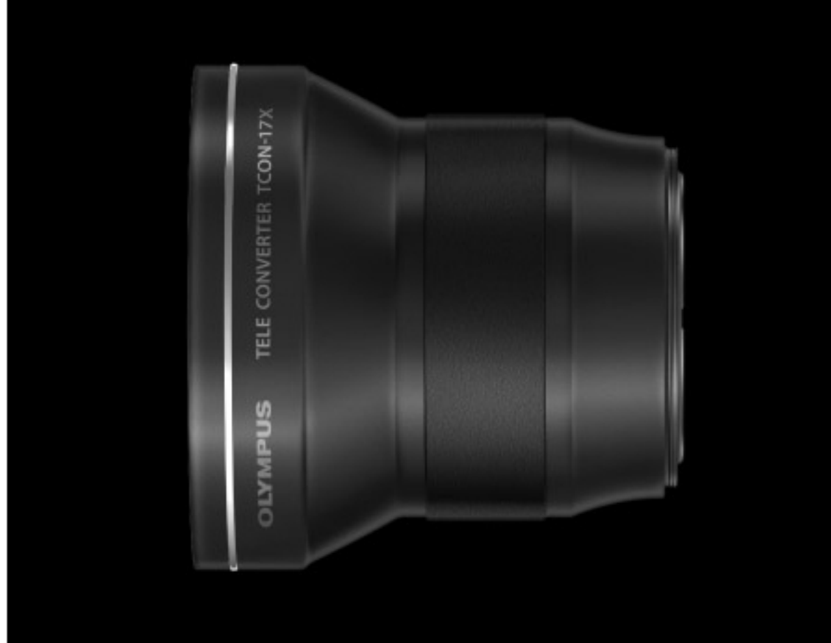
テレコンバージョンレンズ TCON-17X