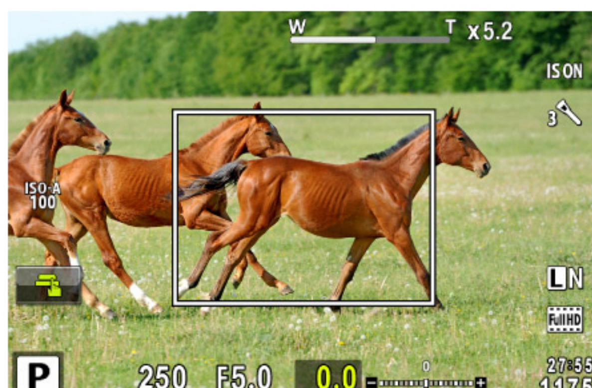
Fn1ボタンを押すと広角になる Fn1ボタンを押し続けて離すと元に戻る