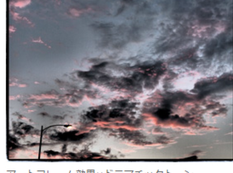
アートフレーム効果×ドラマチックトーン

アートフィルターの魅力をいっそう高める「アートエフェクト」。撮影者が意図したイメージをより際立たせ、撮影者の想像を超えたクリエイティブな表現を、手軽に楽しむことができます。