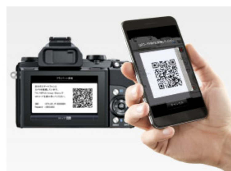
QRコードによる簡単設定

Wi-Fiボタンをタッチするだけで専用アプリとつながり、画像転送できます。「シェア予約」機能を使えば、ワンタッチで選んだ画像だけをすばやくスマホに取り込めます。面倒な初期設定はカメラに表示されるQRコードを読みとるだけ。煩わしい初期設定も数ステップで完了します。