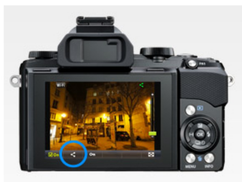
再生画面でシェアボタンをタッチ、シェアマークを付ける。