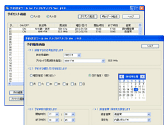
パソコン予約画面

PJ-25をパソコン(Windows/Macintosh)と接続して、予約録音や放送局名の編集、録音フォルダーの作成などができます。