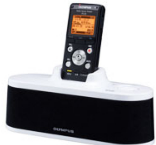
PJ-25+スピーカー&アンテナステーション