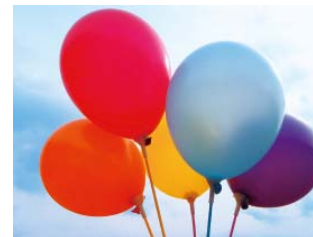
↑ポップ 静止画/動画