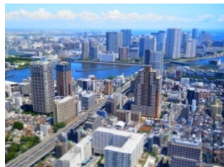
↑ミニチュア 静止画/動画