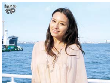
逆光+ポートレート