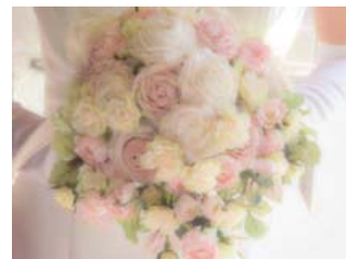
↑ウエディング 静止画/動画