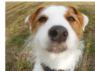
↑フィッシュアイ 静止画/動画