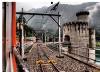
↑ドラマチック 静止画