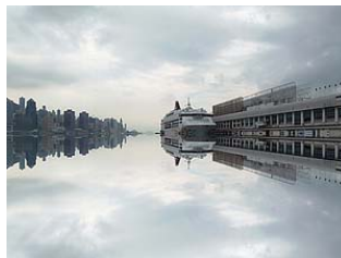
↑ミラー 静止画/動画