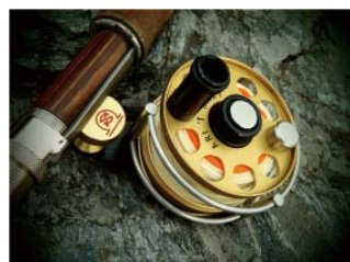
↑ピンホール 静止画/動画