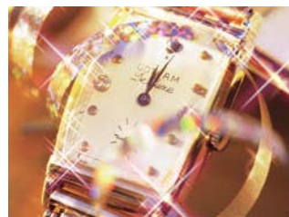
↑クリスタル 静止画