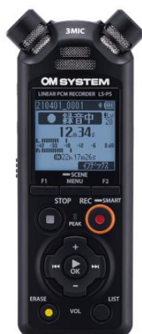
リニア PCM レコーダー「LS-P5」

高い録音性能、豊富な機能、使いやすい操作性を備えた当社の IC レコーダーは、株式会社 BCN 主催の「BCN AWARD 2022」IC レコーダー部門において「最優秀賞」を受賞し、国内販売台数 7 年連続シェア No.1 ※1 を獲得しています。