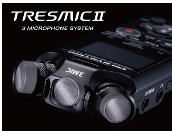
高性能マイクシステム「TRESMIC II」

「LS-P5」は、指向性制御が可能な 3 つの大型高性能指向性マイクを搭載した新マイクシステム「TRESMIC II」を採用。それぞれのマイクが指向性をバランスよく制御することで、低音域から高音域まで原音に忠実な高性能録音が可能となり、繊細な音もありのままにとらえます。さらに、3 つのマイクからの入力をミキシングし、音質を維持したまま指向性を 21 段階まで調整できる「ズームマイク」機能を搭載。鳥のさえずりや講演会での録音など、使用シーンに応じて最適な設定を選ぶことができるほか、録音レベルもズームに合わせて自動で調整します。また、これらのマイクは 125dB SPL の高耐音圧の特性を持ち、飛行機やライブハウスなどの大音量やクラシック音楽のような広いダイナミックレンジを持つ音源でも歪むことなく、忠実に音を取り込むことが可能です。