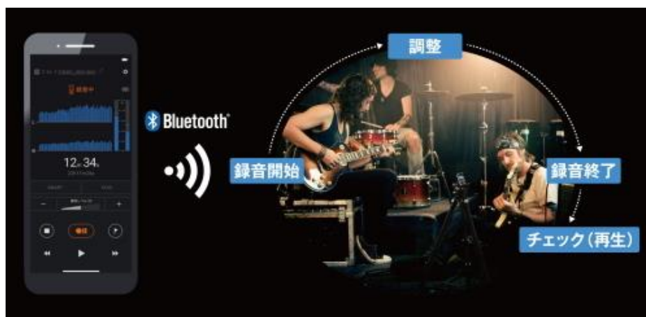
スマートフォンからリモート操作が可能

「LS-P5」は、Bluetooth®を搭載しており、Bluetooth®対応の外部機器との連携※3 が可能です。無料でダウンロードできる専用のスマートフォンアプリ「DVR.Remote」(iOS/Android) を使えば、録音から再生までの一連の操作をスマートフォンからリモートで簡単に操作することができます。音源に対して最適な位置に「LS-P5」を置いたまま、録音の開始・停止だけでなく、録音中の録音レベルの調整も手元のスマートフォンでリモート操作できるので、音楽の演奏や会議、野鳥の鳴き声の録音など、離れた場所からの録音時にとても便利です。さらに、録音した音の再生もリモートで操作することが可能です。「LS-P5」をマイクとして設置した場所に置いたまま、無線接続したスピーカーで再生するなど、音楽演奏やバンドの練習などでの確認作業も簡単におこなえます。