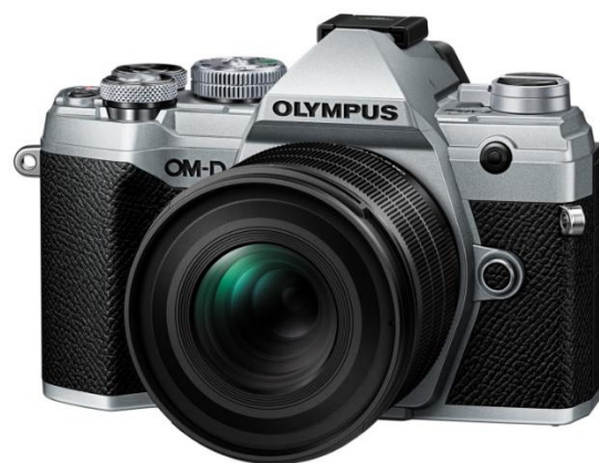
「OLYMPUS OM-D E-M5 Mark III」 (シルバー) 装着時