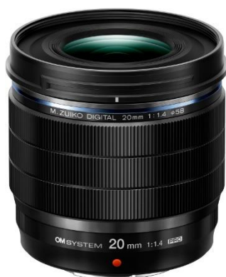
「M.ZUIKO DIGITAL ED 20mm F1.4 PRO」